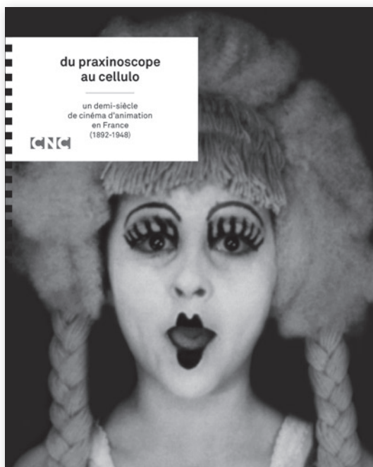
couverture de l'ouvrage Du praxinoscope au cellulo, un demi-siècle d'animation en France (1892-1948) édité par le CNC