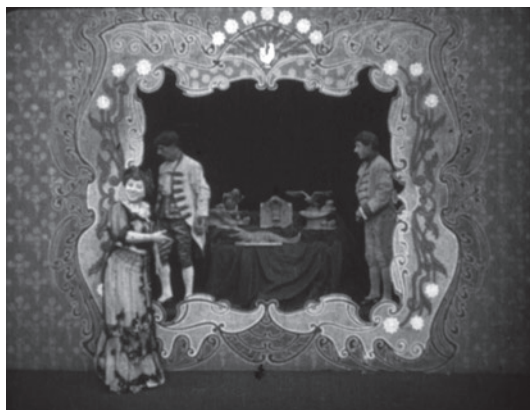
Sculpteur moderne de Segundo de Chomon, 1908

L'édition du DVD qui accompagnera l'ouvrage édité par le CNC, l'accompagnement au piano des films muets lors de la rétrospective, et d'autres initiatives connexes, ont été rendus possibles grâce au mécénat de Natixis qui a trouvé dans cette opération une très belle illustration de son soutien aux « Patrimoines d'hier, Trésors d'avenir ».