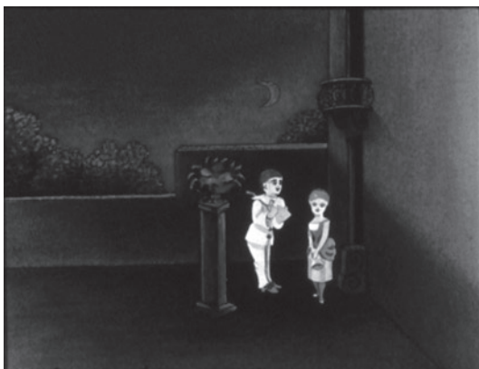
Pauvre Pierrot d'Émile Reynaud, 1892