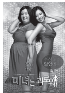
200 Pounds Beauty de Yong-hwa Kim

Selon les chiffres communiqués par le principal exploitant local CJ CGV, les entrées dans les salles de cinéma sud-coréennes reculent de 10,8 % au cours du premier semestre 2007 (72 millions). La fréquentation reste cependant supérieure à celle des années précédentes. La part de marché des films nationaux s'établit à 47,3 % sur la période, contre 59,5 % au cours du semestre correspondant de 2006. C'est le niveau le plus bas constaté depuis 2001. Le box-office du semestre est dominé par un film coréen, 200 Pounds Beauty , qui réalise 6,3 millions d'entrées. Les films coréens et américains se partagent à part égale le top 10 des films. Les films américains, notamment grâce au succès de films tels que Spiderman 3 , le dernier opus de Pirates des Caraïbes et la Nuit au musée , assurent 27,9 % des entrées totales.