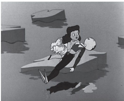
Le Petit soldat de Paul Grimault, 1948

Du 4 au 14 octobre prochain se tiendra à la Cinémathèque française une rétrospective initiée par les Archives françaises du film du CNC sur un demi-siècle d'animation en France.